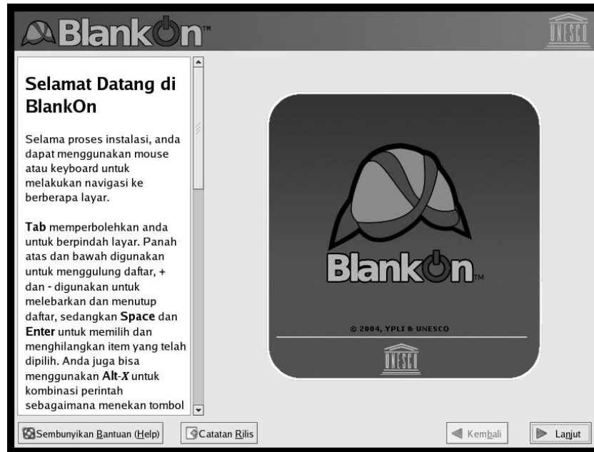
Figure-1. Fast and easy installation with Bahasa Indonesia.