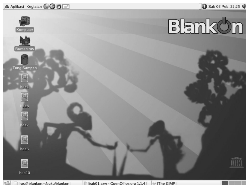
Figure-2. Desktop with Indonesia related look and feel